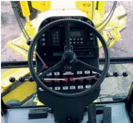
Gute Sicht nach allen Seiten mit verstellbarem Euro-Steuerpult, NAIS Steuerpult auf Wunsch