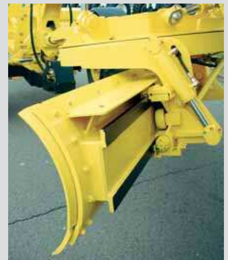
Hydraulische, stufenlose Schnittwinkelverstellung