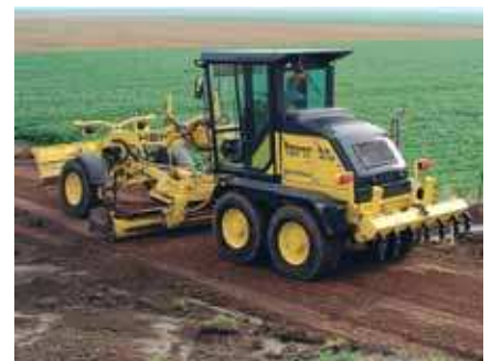
BG 110 TA, der kompakte Tandem-Grader, ideal für kleine und mittlere Baustellen.

für jeden Einsatzzweck: Der kompakte 2-Achs-Grader BG 90 ist ideal für kompakte Baustellen innerorts, Radwege- und Sportstättenbau. Die mittleren 3-Achs-Typen BG 110 und BG 160 sind die Universalmaschinen