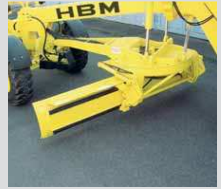
Ausgefällte Kinematik für schnelles Einstellen der gewünschten Scharposition

besten Einsatz im Böschungs- und Grabenbereich. Eine serienmäßige Überlastkuppelung im Drehkranzgetriebe schützt die Schar vor Beschädigungen. Der Rollendrehkranz ist spielfrei gelagert und garantiert höchste Präzision beim Feinplanum. Weitere Vorteile sind leichtgängige Drehbewegungen mit hoher Drehmomentübertragung. Die hydraulische Schnittwinkelverstellung sorgt für beste Anpassung an den Material-Rollwiderstand. Die Scharführungsleisten aus Spezialstahl (Hardox) sind horizontal und vertikal nachstellbar. Automatische Differential-Sperren in den angetriebenen Achsen - bei den Allradgradern auch zwischen Vorder- und Hinterachsen - sorgen für optimale Schubkraft. Beste Kraftübertragung durch außenliegende Planetengetriebe in den Rädern.