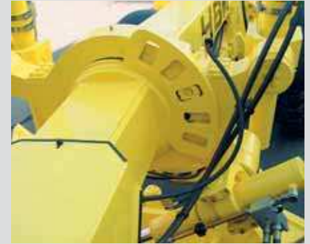
Verstelljoch für Böschungs- und Grabenarbeiten