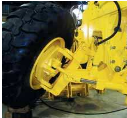
Angetriebene Vorderachse mit Radsturzverstellung