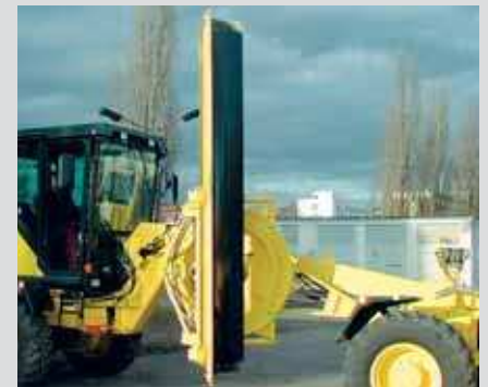
Drehkranz wahlweise gleitschuhgelagert oder rollengelagert, Böschungswinkel 90° rechts und links