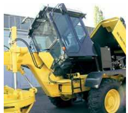
Gute Wartungszugänglichkeit: Kabine und Motorhaube kippbar